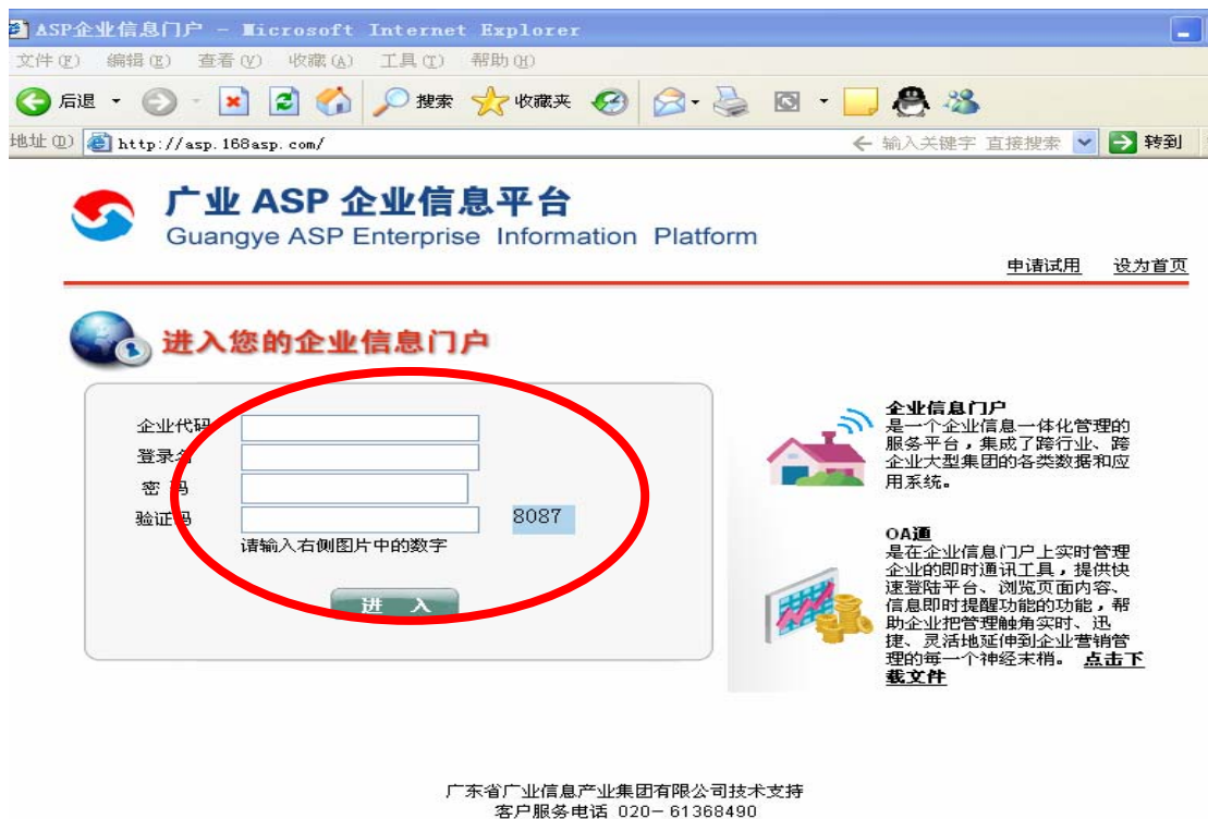
图 5 进入企业信息平台界面