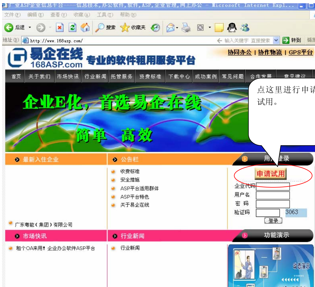
图1 http://www.168ASP.com 页面