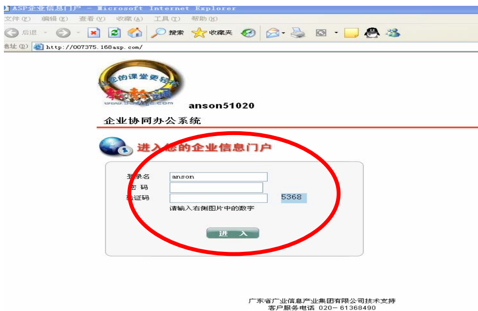
图 6 http://007375.168asp.com/ 登录平台