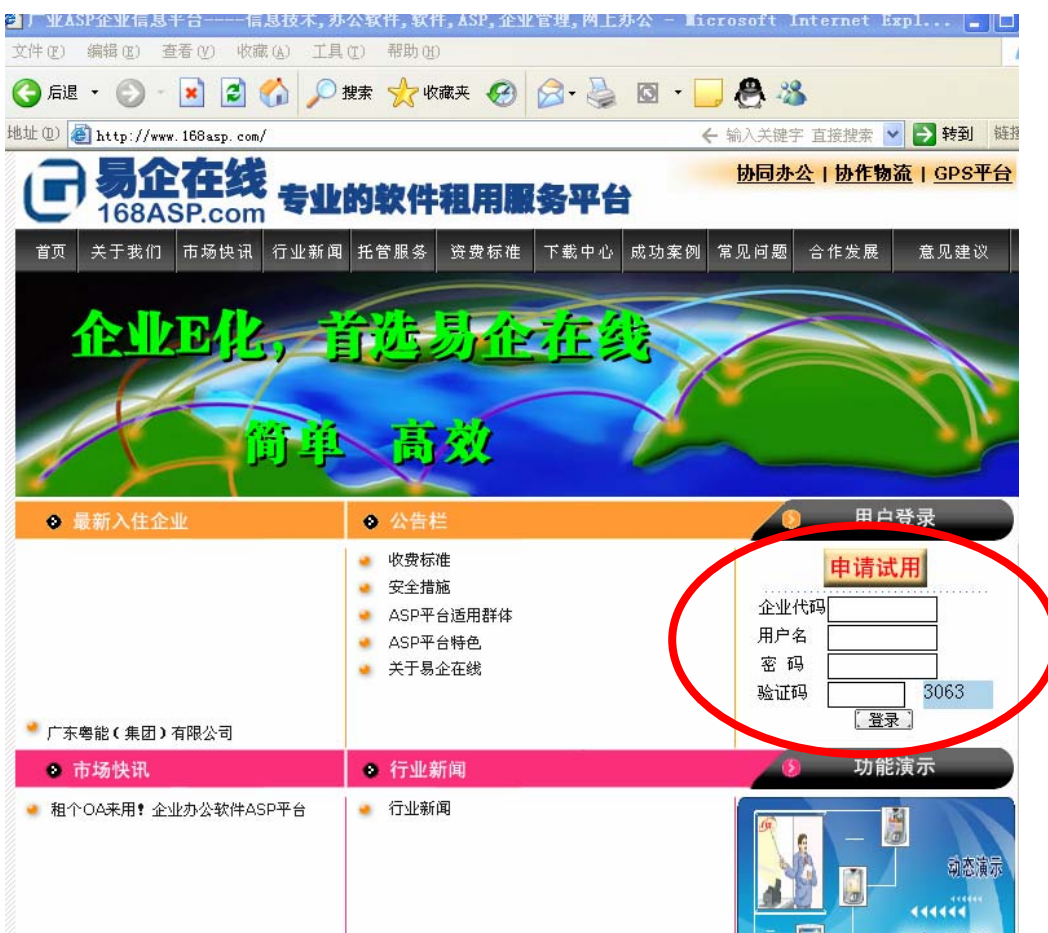
如图 4 所示：