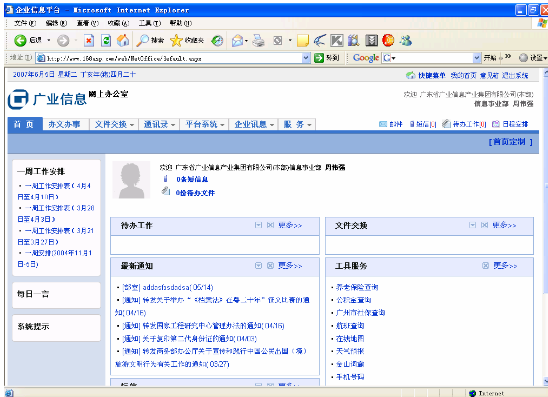
图 7 ASP 平台的办公桌面